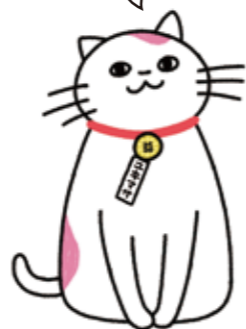
日本行政書士連合会 公式キャラクター ユキマサくん